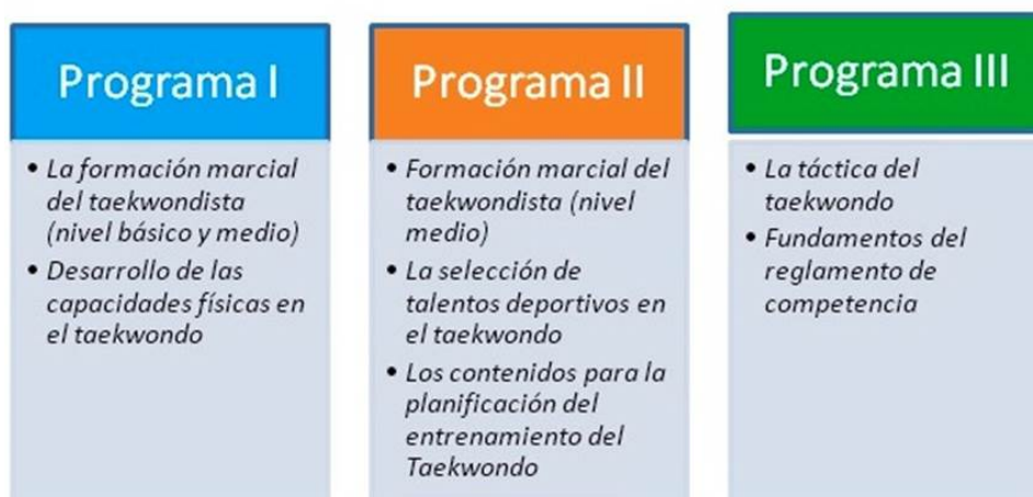
Figura 1. Temas de los primeros programas correspondientes al plan de estudio “D” (CRD, CRAAR y CPT) del taekwondo universitario de la UCCFD “Manuel Fajardo” de La Habana ( ISCF “Manuel Fajardo. Sección de Taekwondo, 2006 )

lo relacionado con la formación del profesional del taekwondista cubano.