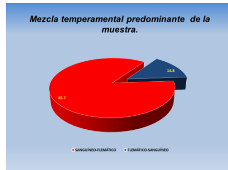
Figura 1. Mezcla temperamental más frecuente en judocas estudiados.

La mezcla temperamental más frecuente en los judocas fue sanguíneo- flemático, con el 85.7 % (12 judocas) y 2 judocas que representan el 14.3% flemático-sanguíneo. Con un porcentaje de la media grupal del 77,2% y el 64,3% respectivamente. (Figura 1)