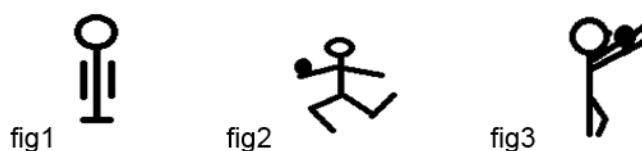
Figura 3. Ejercicios de pasos bailables.